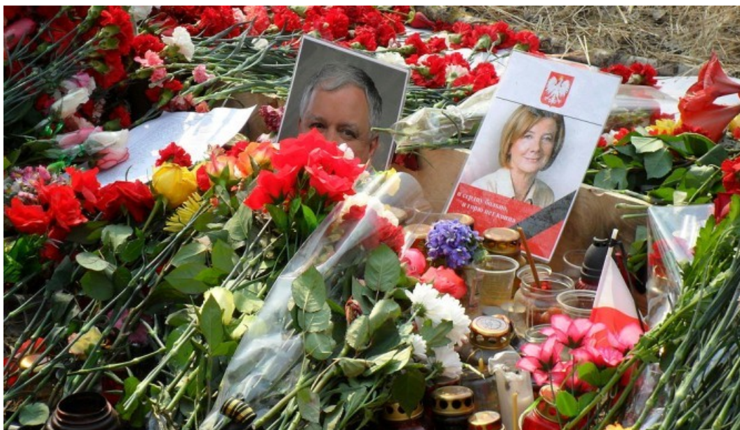
Kwiaty i znicze na miejscu katastrofy